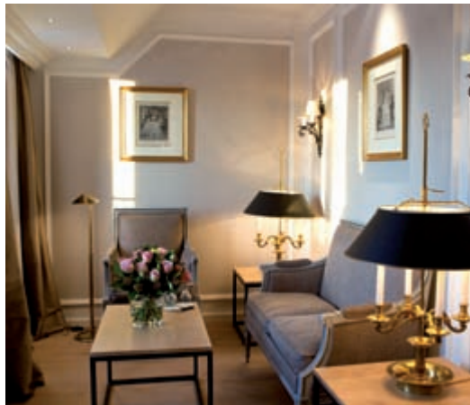
Junior Suite Wohnzimmer